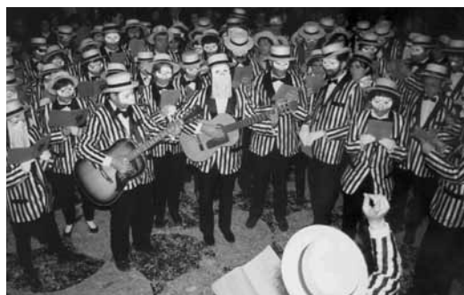
Coros de carnaval , 1995