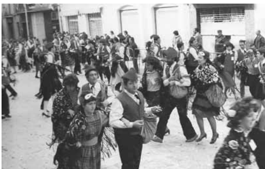
Comparsa d'El Coro, a la Plaça de les Cols. Febrer 1983