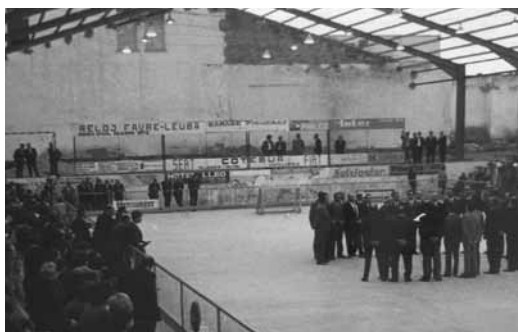
Cantada al Pavelló d' esports en motiu de la inauguració del Monument a Anselm Calvé. 25 d'octubre de 1970