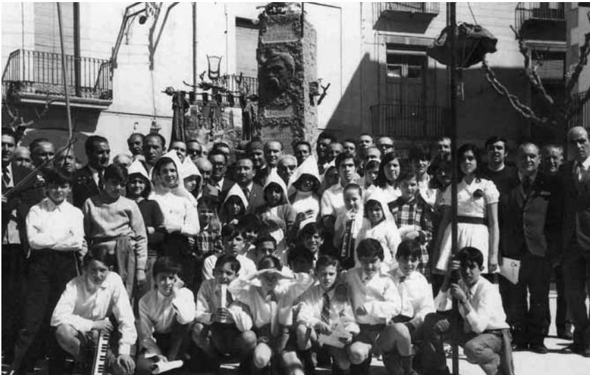
Caramelles mixtes, adults-infantils, davant del monument a Anselm Clavé. Abril de 1972