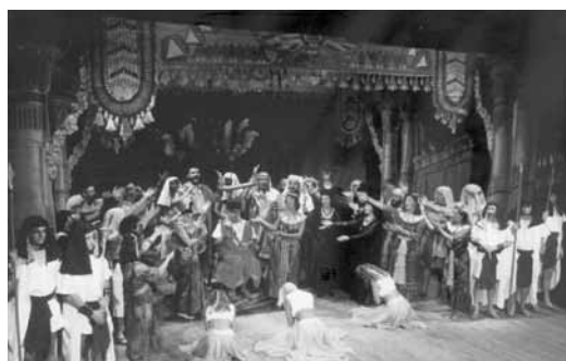
Obra de teatre " La Corte del Faraón" Al principal. Estiu de 1989