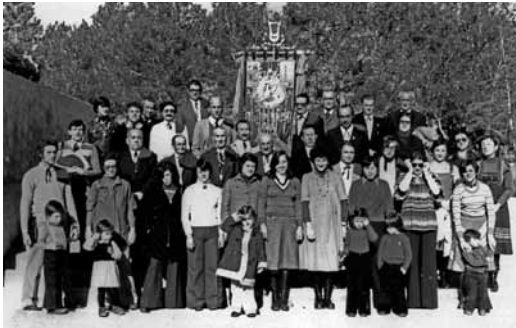
Cantada als Camils. Tardor de 1975