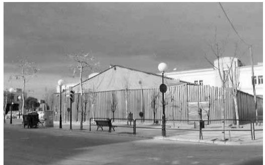
L'Envelat a la plaça Casernes. Febrer 1991