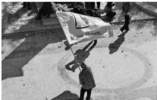
Les comparses de l'Unió 2008