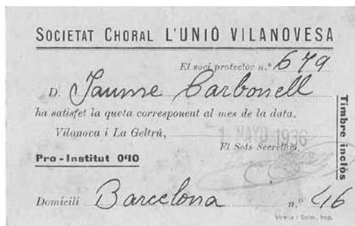
Carnet de soci de 1936