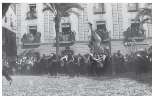
Comparses del Coro i de l'Acord, a la plaça de la Vila. Febrer 1985