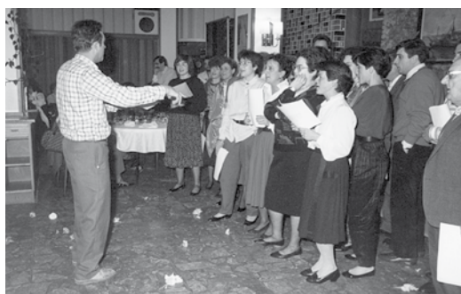
Cantada en el marc de la celebració dels 125è aniversari, al restaurant Cossetània. 1986