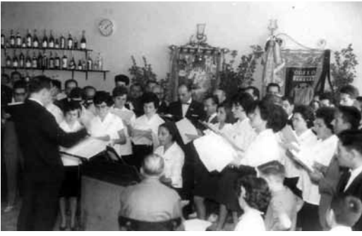
Canta conjunta amb l'orfeó Pirelli al local social. 4 d'octubre de 1964