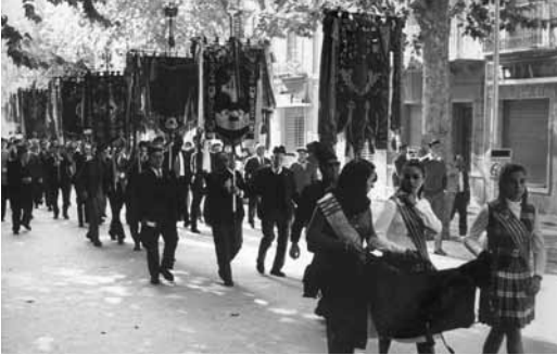
Desfilada dels penons de les corals participants en els actes de la inauguració del monument a Anselm Clavé. 25 d'octubre de 1970