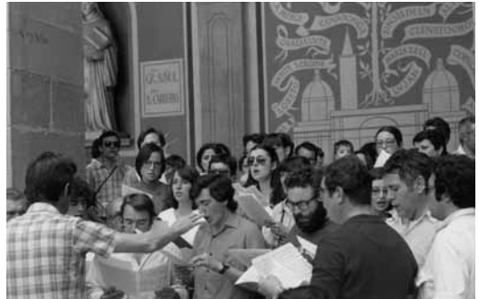
Anada a Montserrat. Juny de 1979