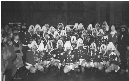
Arrivo d'El Coro (policia local)