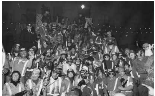
Arrivo de l'Acord (la Flotan)