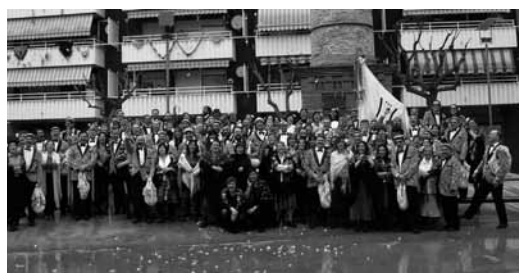
Les comparses de l'Unió 2006