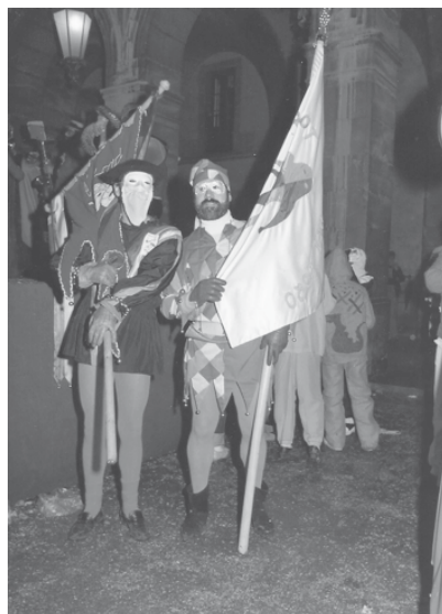
Agermanament dels Vidalots de l'Acord i El Coro. 1983