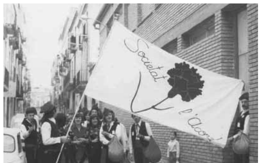
Comparsa de l'Acord a la seu social del carrer Pàdua. Febrer 1983