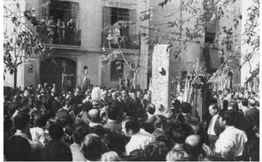
Inauguració del monument a Anselm Clavé a la Plaça Major, 25 d'octubre de 1970