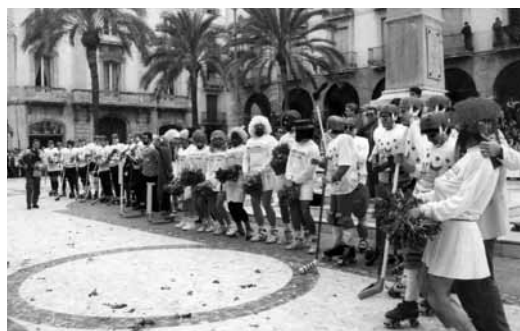
Actes esportius del dissabte matí, hokey sobre gel, 1990