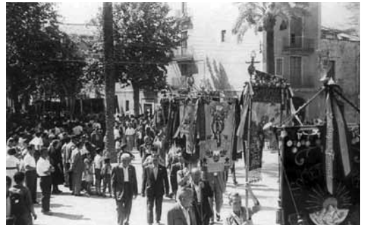
Desfilada de penons de les corals participants, en els actes del centenari. 17 d'agost de 1958