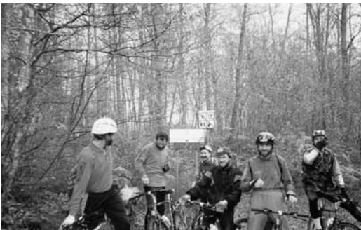
Sortida del grup ciclista de la Unió. Tardor de 1990