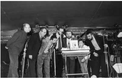
Celebració del 10è aniversari de la fusió Coro-Acord. 1997