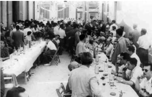
Celebració popular del centenari, al carrer col·legi, davant la seu social. 17 d'agost de 1958