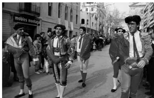
Actes esportius del dissabte matí, la corrida de toros, 1994