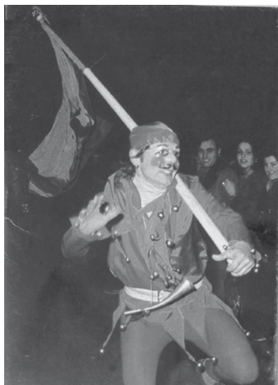
El primer Vidalot d'El Coro.