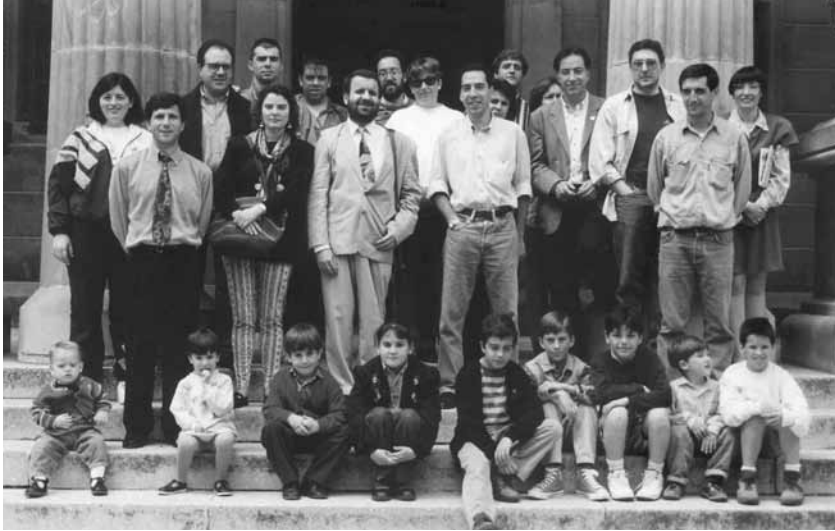
Homenatge a la sòcia d'honor la mòmia Nessi. Maig de 1993