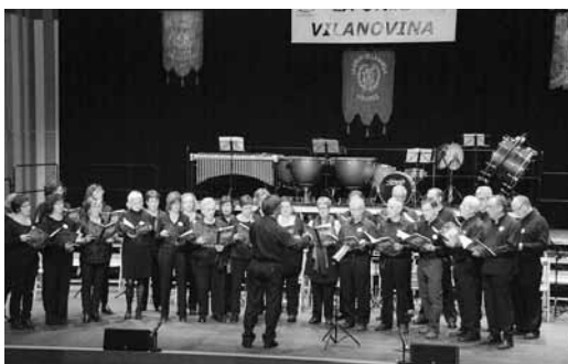
Cantada de la coral de la Unió Vilanovina en el concert commemoratiu dels 150 anys, a l'auditori Eduard Toldrà. 25 de novembre de 2011