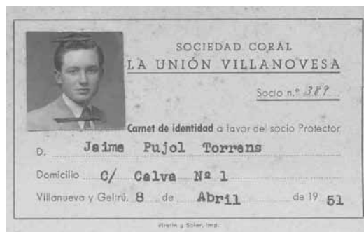
Carnet de soci de 1958,