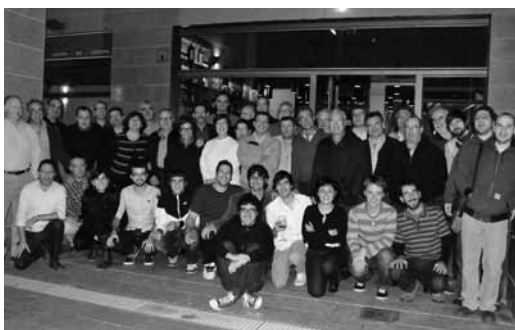
Sopar de membres i ex-membres de la Junta. Novembre 2011