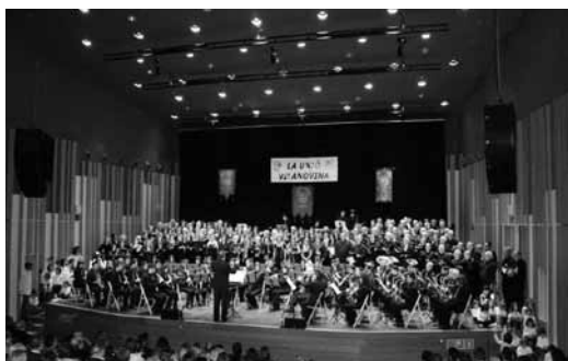
Cantada conjunta de les corals vilanovines en el concert commemoratiu dels 150 anys, a l'auditori Eduard Toldrà. 25 de novembre de 2011.