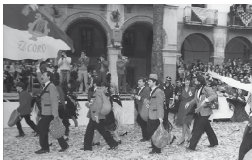
Comparses del Coro i de l'Acord, a la plaça de la Vila. Febrer 1985