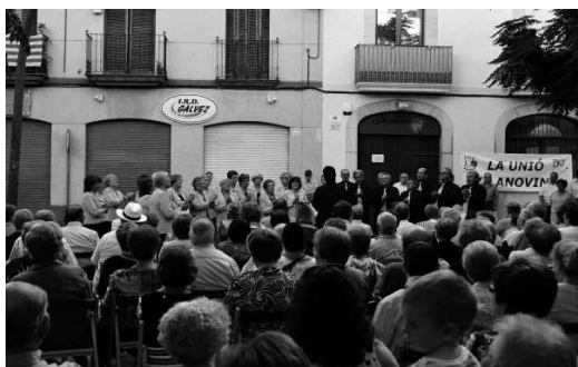
Cantada de Cors Clavé en commemoració del 150è aniversari de la Unió. Plaça Pau Casals 31 de juliol 2011