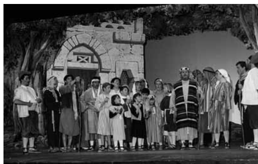
Els Pastorets al teatre Principal. Nadal 1993