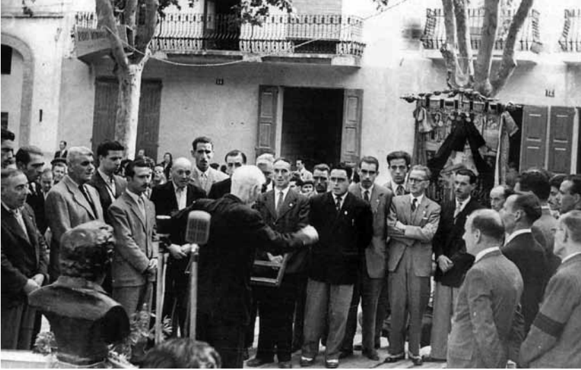
Cantada d' "El Coro" a la Rambla Francesc Macià, en la celebració dels actes del 75è aniversari. Juliol de 1936