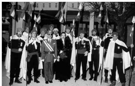
Arribo de 1995. La guardia de Franco al pati de La Unió