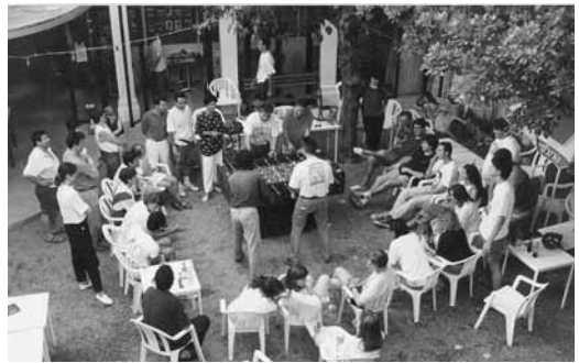
Campionat social de futbolí al pati del local del carrer Teatre. Primavera 1993