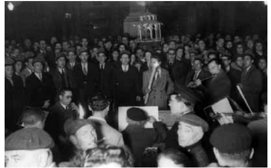
Cantada de nadal·les a la plaça del 18 de julio. Desembre 1947