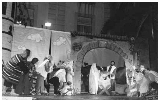
La Unió organitza l'acte final de l'Arribo de Vilanova. Febrer 1997